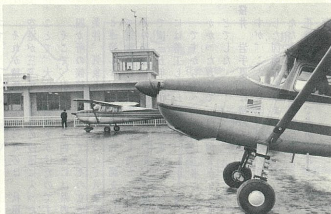
この日は雨のため、コンベアに代ってセスナ機が降り、開港を祝いました。