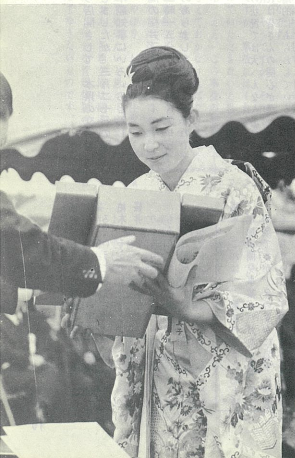
開港を記念して、ミス花巻空港も晴れの表彰をうけました。