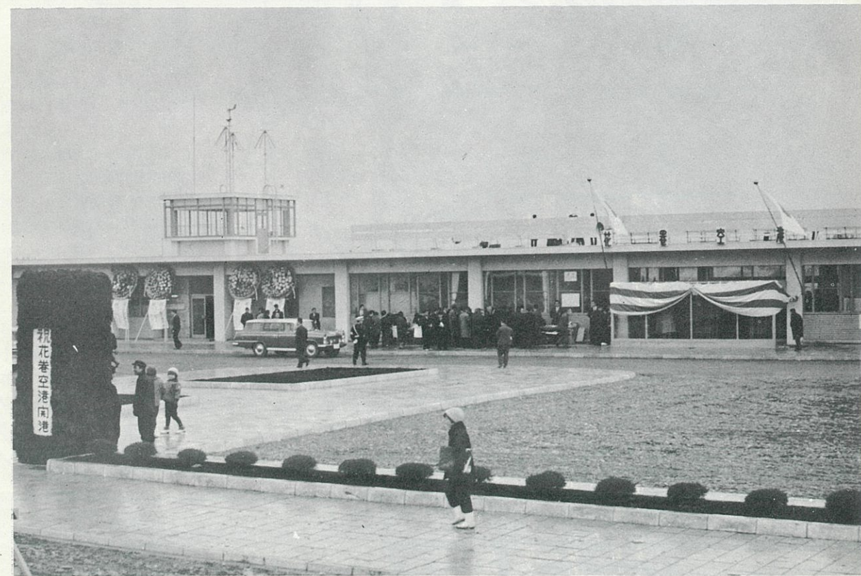
ターミナルビルには、紅白の幕が張られ、開港気分を盛りあげていました。