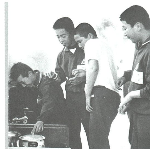
この日のメニューはカレーでした