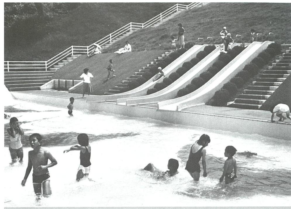
フィールドアスレチック風遊具に、ジャブジャブ池に、子供たちの歓声が絶えないワンパクジャブジャブ広場。おともなも楽しめそう

春は桜、夏はハマナスが咲きほこる水辺公園。ボート池にはペダルボートや手こぎのボートが用意されています