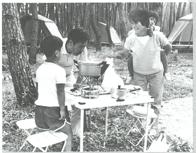
テントサイト、炊事場などが用意されているキャンプ場。無料で使えます。テントのない方には1張1,500円で貸出しOK。