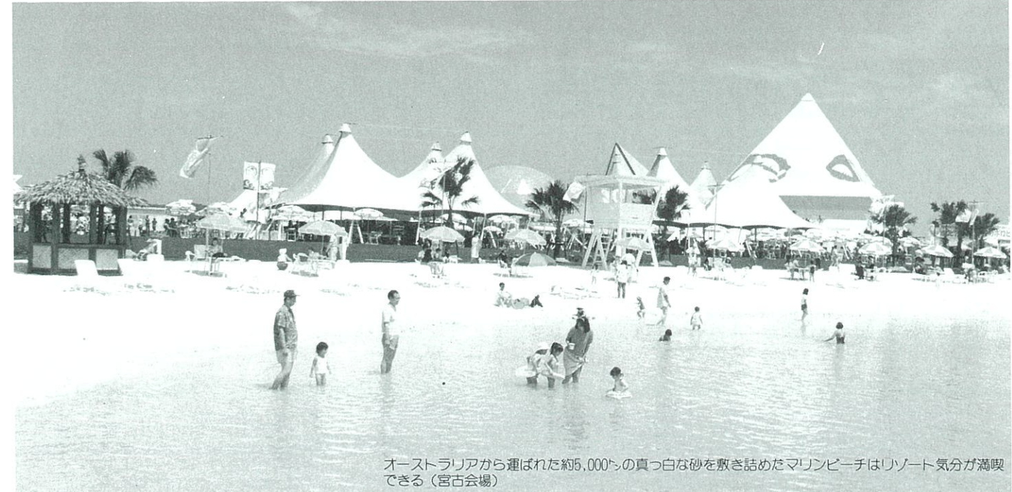
オーストラリアから運ばれた約5,000トンの真っ白な砂を敷き詰めたマリビーチはリゾート気分が満喫できる（宮古会場）