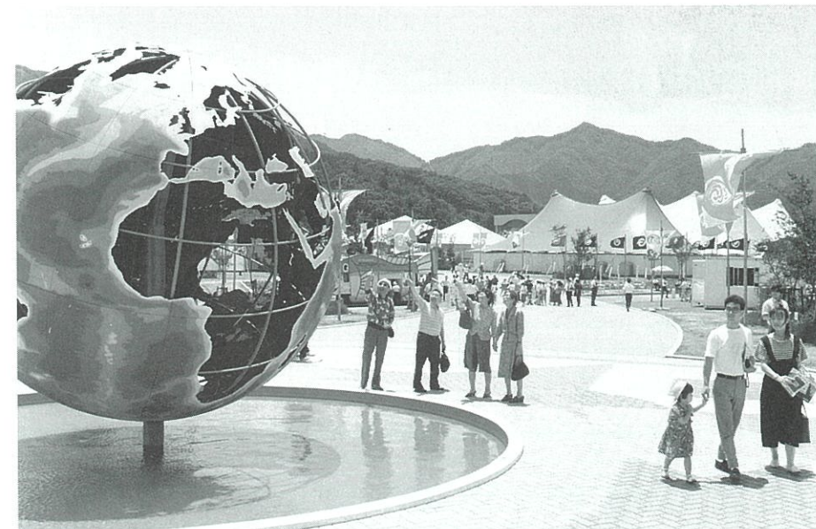
▲博覧会のメインオブジェ・地球儀の前で楽しそうに談笑する来場者（釜石会場）