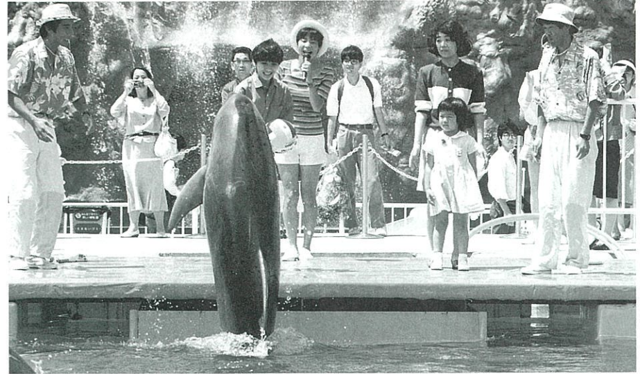
▲イルカの愛きょうたつぷりな演技に観客は大喜び（釜石会場）