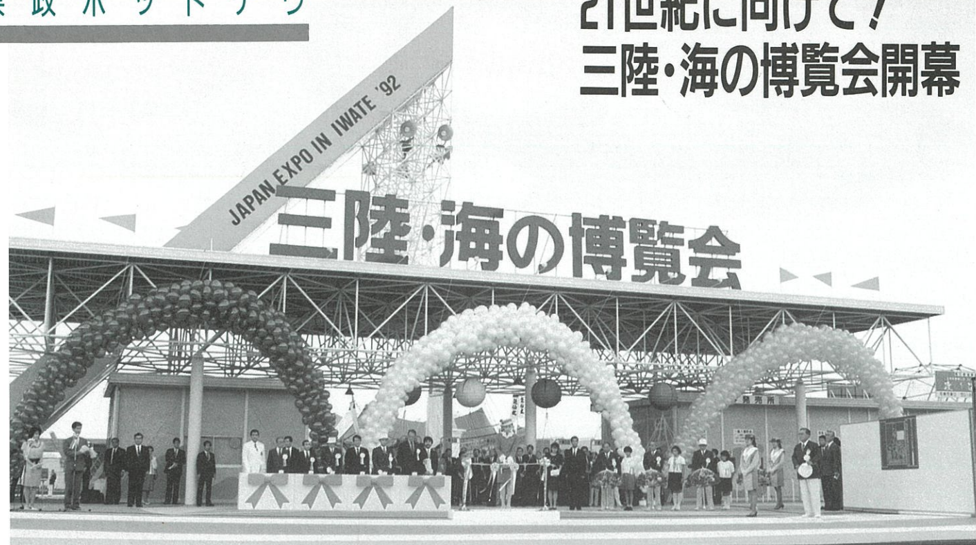
▲7月3日に行われた総合開会式では三笠宮寛仁親王妃信子さまによるテープカットが行われ、博覧会は盛大に開幕した（釜石会場）

「光る海、輝く未来」。この美しく豊かな三陸の海と来たる21世紀に向けた三陸沿岸地域そして岩手の未来を表したテーマのもと、三陸・海の博覧会が7月4日に盛大に開幕した。国のジャパンエキスポの認定を得て開催されたこの本県初の本格的博覧会は、釜石市、宮古市そして山田町の3会場、9月15日までの74日間の期間中に入場者数70万人を目指す。