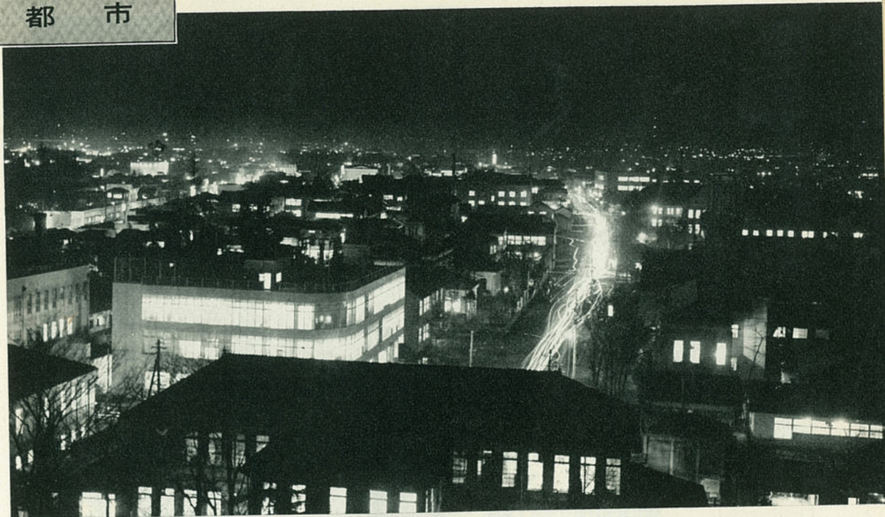
政治、教育、文化の中心地、県都盛岡市の夜景