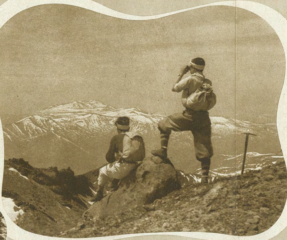
岩手山頂からの展望 標高二千四十一米 山頂からはえんえん長蛇の北上川に貫流される北上平野の中に盛岡が望まれる 写真は山頂から駒ヶ岳方向の大展望