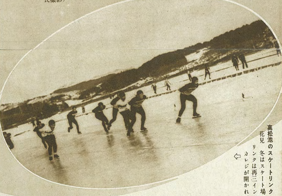
高根池のスケートリンク 春は花見 冬はスケート場 高松リンクは再三インターカレッジが開かれている