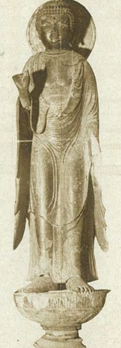
久慈の薬師如來 九戸郡久慈町長福寺にあり慶原末期の京佛師の手になるものといわれる 薬師堂には文明 元龜等の棟札もある