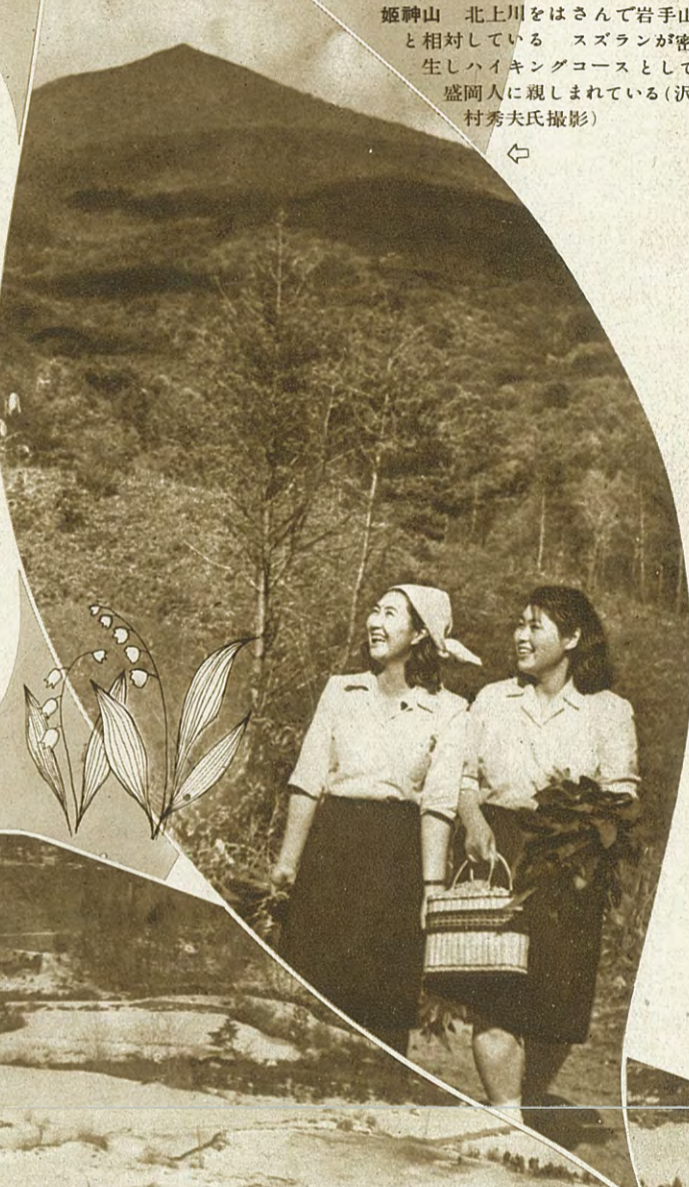
姫神山 北上川をはさんで岩手山と相対している スズランが密生しハイキングコースとして盛岡人に親しまれている