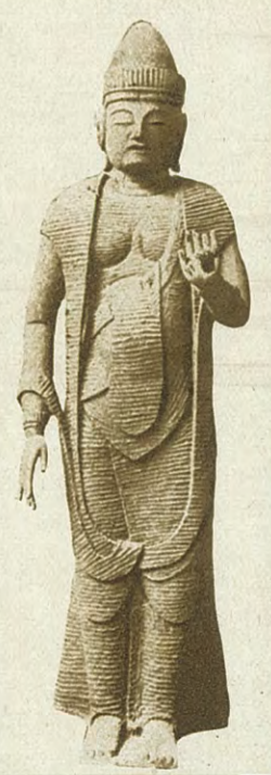
天台寺の観音(国宝) 二戸郡浄法寺村八雲山天台寺の本尊聖観音像は三尺五分の木刻立像で僧行基の作と傳えられ彫法は俗に鉦作りと称せられ尊容端整 名作の誉れが高い