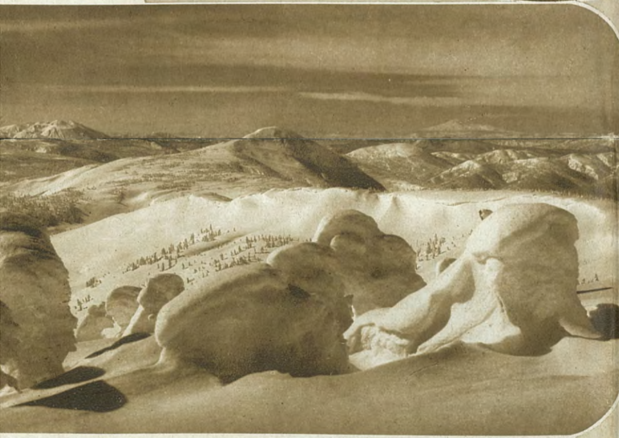
樹氷 八幡平の樹氷は蔵王の樹氷より美しいといわれる スキーに乗って晴れた日みる樹氷は神々しいまでである