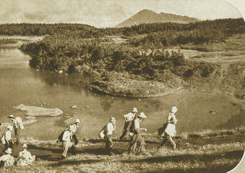
八幡沼から岩手山を望む