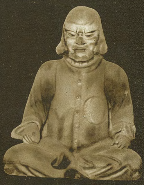
マルコポーロ像 五百羅漢の中に二つの異様な像がある その一つはこの像であり マルコポーロの像と傳えられるポタンらしい マルコポーロは東洋へやって来たとき佛教に傾倒したらしいというつもりか