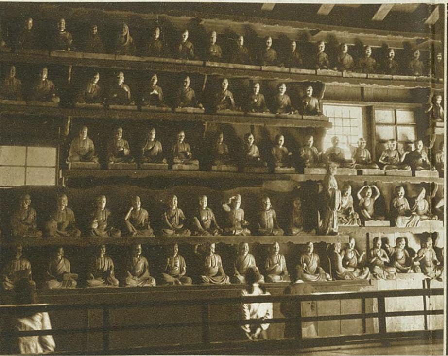
五百羅漢 盛岡市北山の観音寺羅漢堂にロシヤマ佛を本尊とし五百の羅漢が三方に列んでいる 享保年中京都の佛師野野下等によって彫成され面模姿態悉く異なるのは味のあるところ