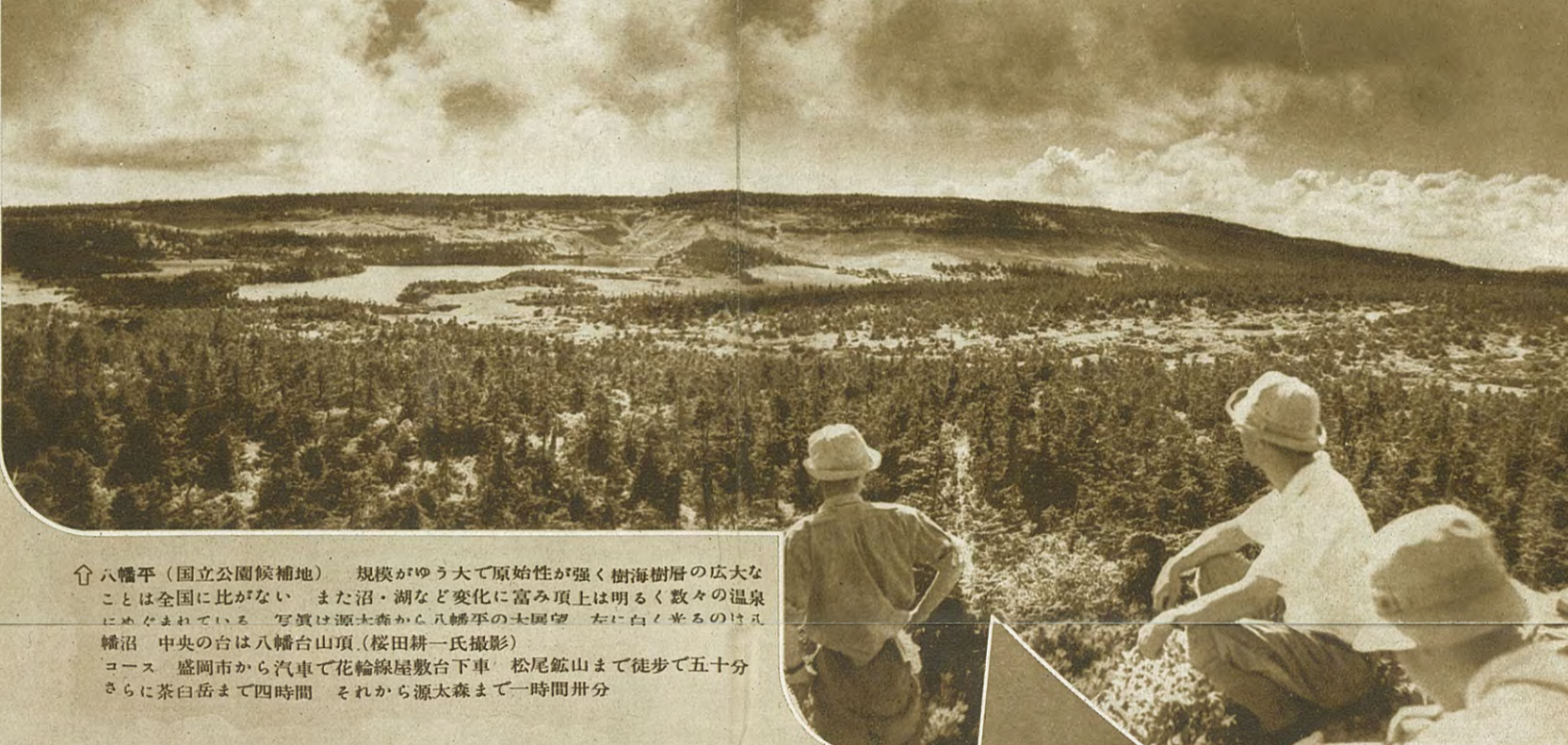
八幡平(国立公園候補地) 規模がゆう大で原始性が強く樹海樹層の広大なことは全国に比がない また沼・湖など変化に富み頂上は明るく数々の温泉にめぐまれている 写真は源太森から八幡平の太田望 左に白く華るのは八幡沼 中央の台は八幡台山頂 コース 盛岡市から汽車で花輪線屋敷台下車 松尾飯山まで徒歩で五十分さらに茶臼岳まで四時間 それから源太森まで一時間冊分