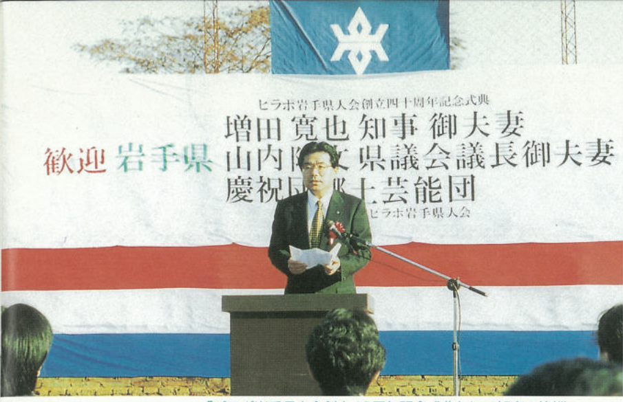
「ピラボ岩手県人会創立40周年記念式典」にて知事の挨拶