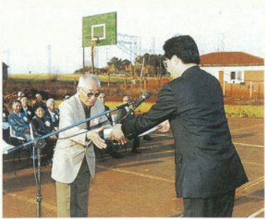
「ピラボ岩手県人会創立40周年記念式典」にて増田知事から開拓功労者へ感謝状の贈呈