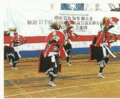
「ピラボ岩手県人会創立40周年記念式典」にて郷土芸能使節団による鬼剣舞の披露