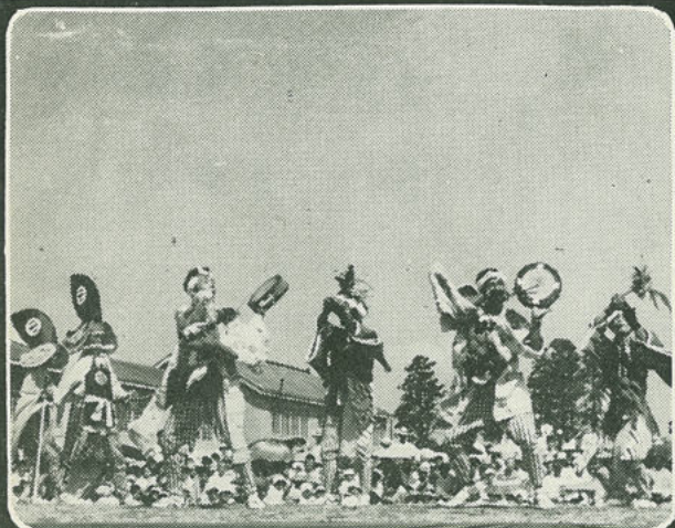
8月16日 第2回みちのく郷土芸能祭が行なわれ、岩手が誇る郷土芸能19団体が、その粋を披露しました。(北上)