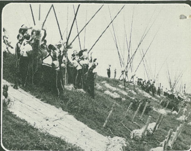
8月8日 台風シーズンを控え、恒例の水防演習が行なわれ、磐井川堤防に空陸一体の絵巻きをくりひろげました。(一関)