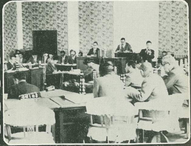
5月10～14日 改選後初の臨時県議会が開かれ、正副議長などの役員人事を決め新しい県政のスタートをきりました。(盛岡)