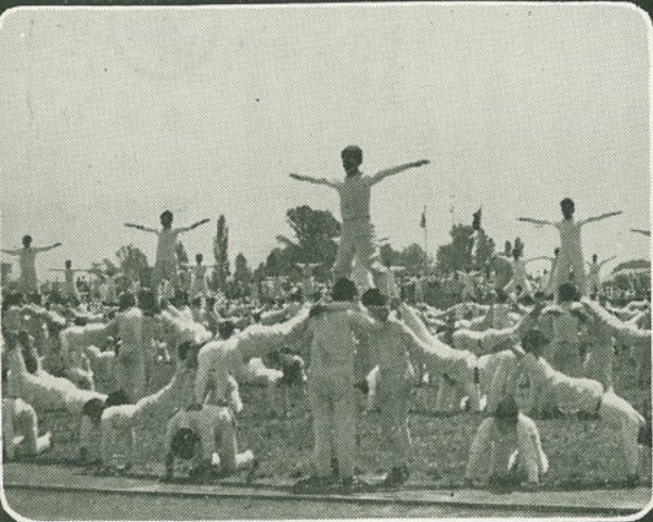
5月19日 第9回日本体操祭盛岡大会は、県営グラウンドに約1万人が参加して若さと健康の美を展開しました。(盛岡)