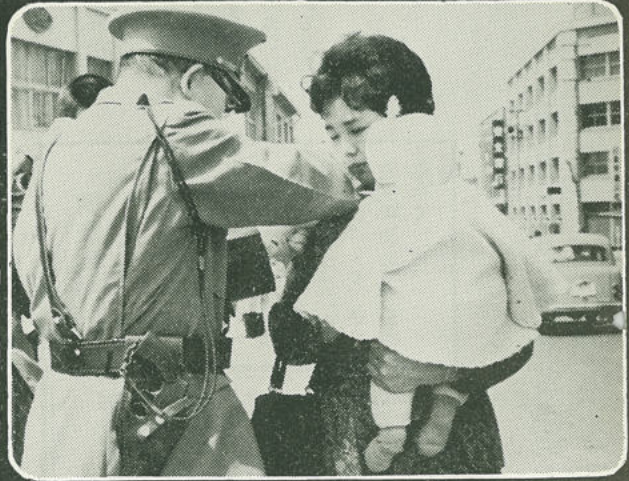
5月11～20日 交通事故から子供を守ろうと、春季全国交通安全運動が展開され、みんなで交通安全をはかりました。(盛岡)