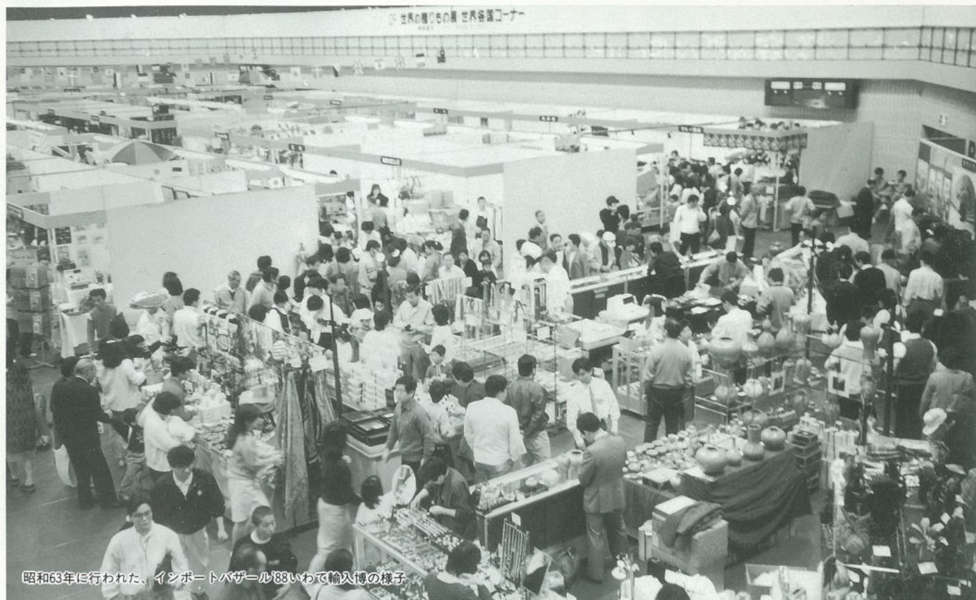
昭和63年に行われた、インポートバザール88いわて輸入博の様子

4月29日から5月5日までの7日間、滝沢村のアピオ（岩手産業文化センター）で、「いわて輸入博'94-地球市場-」が開催されます。近年私たちにあって海外旅行や輸入品は身近なものとして定着しつつあります。しかし買って来てはいけないお土産の種類や、個人で手軽に行える輸入のノウハウなどは意外に知られていないようです。海外製品を広く紹介するこの輸入博で、輸入品に対する知識を深めながら、異国の文化に触れてみませんか。