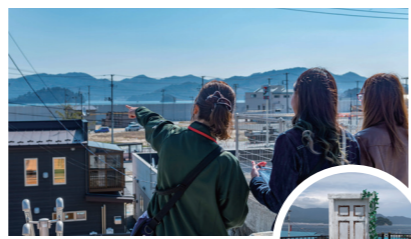
★震災ガイド&まち歩きの後、山田湾展望広場に立ち寄ります。

9/8(日)のエクスカージョンは記録のため動画を撮影します。インタビューのご協力をお願いする場合があります。また後日、岩手県のYouTubeで公開される予定です。