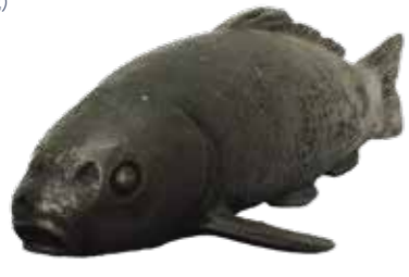
鯉魚置物/堀江尚志作

昭和7年(1932)、「若様」の誕生を祝して南部家に贈られた「鯉魚置物」。贈呈当時の記録や鯉について記された江戸時代の刊行物と共に、この度10年ぶりの公開です。