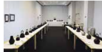
2022年度開催「南部鉄器展」の様子

3月1日(土)～3月17日(月) 共催:南部鉄器協同組合 岩手県を代表する伝統工芸品である南部鉄器。現在も受け継がれてきた伝統の技術を守る職人たちによって作り続けられています。本展では2024年度までに制作された作品を中心にご覧いただけます。