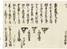
江戸幕府老中奉書(盛岡城修復許可)

【ギャラリートーク】 8月25日(日)・9月24日(火) 13:30～14:30