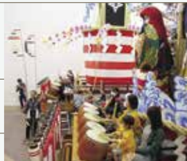
盛岡山車太鼓打ち体験の様子

※展覧会・講座・イベントの日時・内容などは予告なく変更される場合があります。この他にもさまざまな催しを開催いたしますので、詳細は当館ホームページ(https://www.morireki.jp/)をご覧ください。