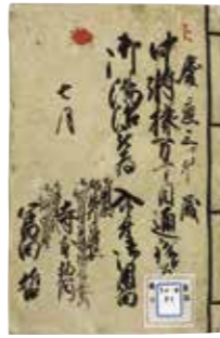
中将様万丁目通船工為御湯治被為入候二付御用留

【企画展特設案内所】 日時:5月3日(金・祝)・6月2日(日)・7月6日(土) 各日11:00～12:00/14:00～15:00 会場:2階企画展示室入口付近 内容:企画展担当学芸員が企画展に関するご質問等にお答えします(1名10分程度)