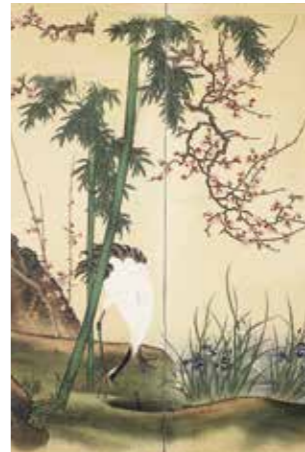
蓬萊図屏風(部分)/狩野林泉筆

蓬萊は、古代中国において東の海にあると考えられた島で、不老不死の仙人が住む仙境のことです。日本でも富士山や熱田神宮周辺などを蓬萊と結びつける伝説が残され、吉祥の象徴として絵画や工芸装飾にも多く表されました。本展ではそんな、誰も見たことのない神秘的な理想郷・蓬萊を描いた作品のひとつ、狩野林泉筆の「蓬萊図屏風」にスポットを当て、そこに描かれた蓬萊の姿をよみ解きます。