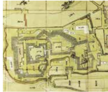
明和盛岡城図(部分)

盛岡藩主南部家の居城であり続けた盛岡城は、明治7年(1874)に破却され、今年はその150年目にあたります。近年、盛岡城跡歴史的建造物復元に向けた動きが活発化しつつも、いまだ復元の決定打となる資料が確認されないなか、盛岡城関連資料は、実際にはどのようなものが残されているのでしょうか。描かれた資料から記された資料、あるいはモノとして残された資料など、現存する諸資料から盛岡城の実態を探ります。