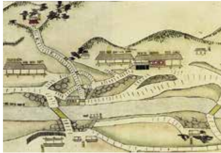
鶯宿庵日記(鶯宿温泉図)

世界有数の温泉大国である日本では至る所で温泉が湧き、現在の私たちは保養と観光をかねて各地の温泉を訪れます。旅が広く行われるようになった江戸時代においては、特に湯治の旅が楽しめるようになりました。本展では、江戸時代の盛岡藩の人々がどのように温泉に親しみ、湯治に出掛けたのか実例を交えてご紹介します。